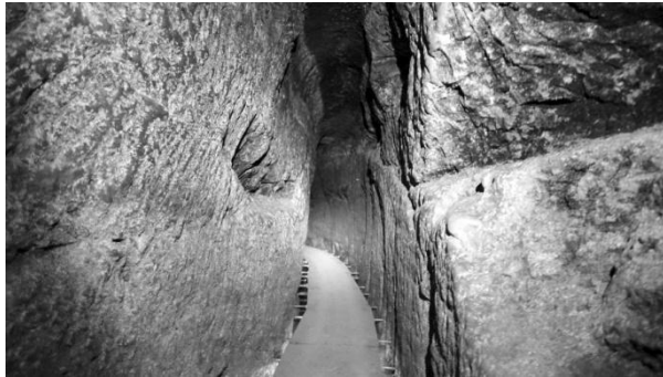
Blick in den Meyerstollen | Vue de la galerie Meyer

Dieses vom Bahnhof Aarau aus direkt zugängliche Tunnelsystem ist einzigartig! Im Rahmen einer Führung haben wir die Hintergründe, welche zum Bau dieser Tunnel geführt haben und viele Geschichten der damaligen Zeit erfahren und auch einen Teil des Tunnels betreten.