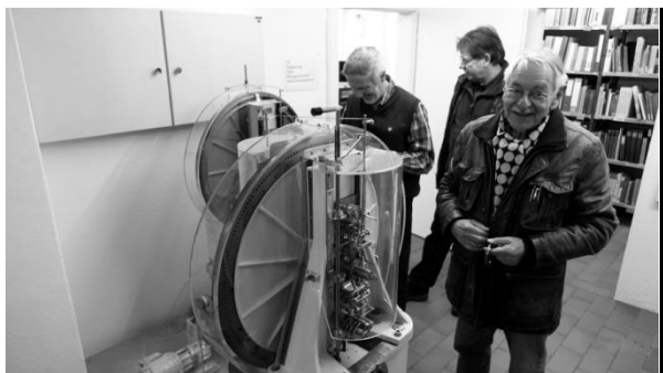
Interessante Ausstellungsobjekte der Sammlung Kern | Des objets intéressants de la collection Kern