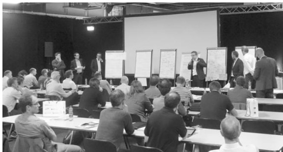
Interessierte Teilnehmer am BIM Workshop | Des participants captivés par l'atelier BIM