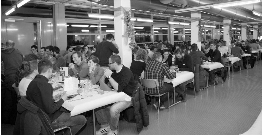
Abendessen zum 50 Jahre Jubiläum | Souper de la fête de la 50 ème volée de diplômés en géomatique à la HEIG-VD