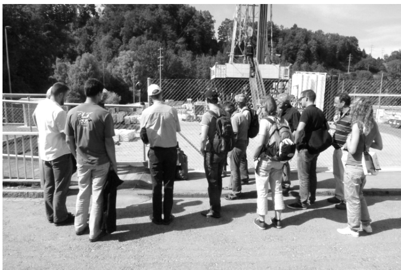
Besichtigung Geothermiebohrung in St. Gallen Visite du forage géothermique à St-Gall

Un rapport détaillé et des photos de l'événement sont disponibles sur notre page Web.