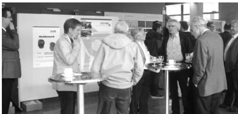
Jubiläumsanlass 50 Jahre IVGI – FHNW am 29. Mai 2013 Anniversaire des 50 ans de l'IVGI – FHNW le 29 mai 2013

La manifestation s'est poursuivie l'après-midi avec divers discours et présentations. Le jubilé s'est achevé dans une ambiance chaleureuse par un apéro riche.